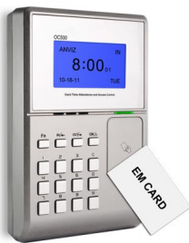
Tarjeta de Proximidad

Los empleados se identifican mediante algún elemento tal como: